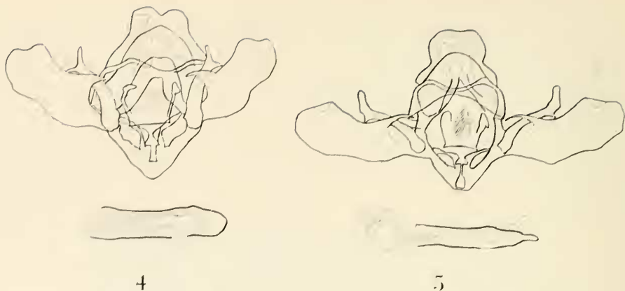
Abb. 4: ♂ Genitalapparat des vermutlichen Hybriden Euphyia adumbraria H. Sch. / frustata Tr.